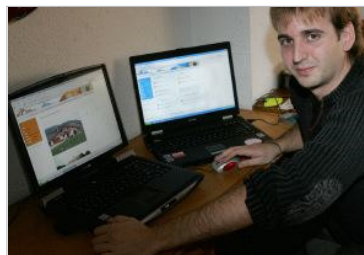
EMPRENDEDOR. Montoya, en la foto, sus hermanos y su novia son los artífices.

Un elevado porcentaje de los usuarios responde al perfil de universitario. De hecho,